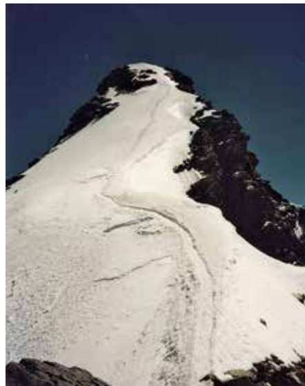
Der Gipfelgrat der Dufourspitze von P. 4499 aus gesehen

Wie auf der Sommerroute. Grosse, klassische Skihochtour, machbar von April bis Mai, manchmal Juni; Skidepot wenig vor dem Sattel; GA.