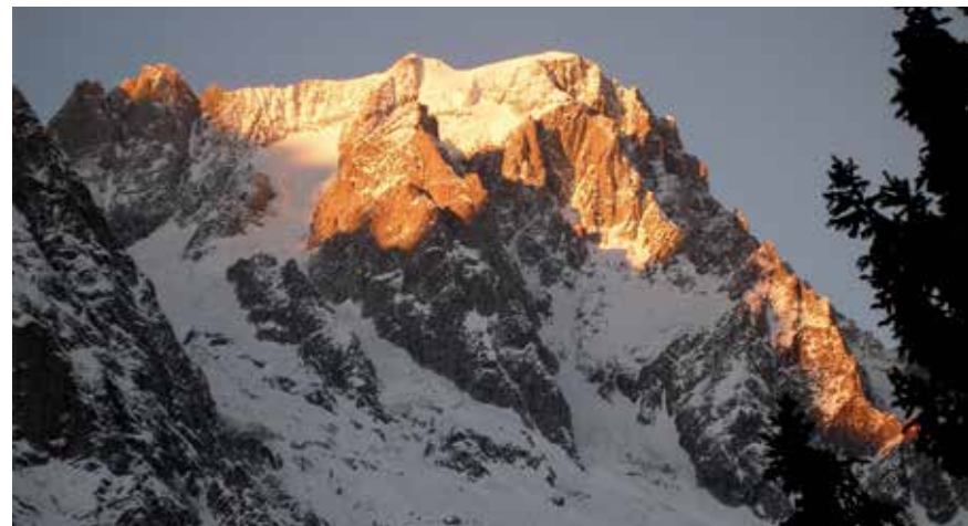
Das letzte Licht an den Grandes Jorasses