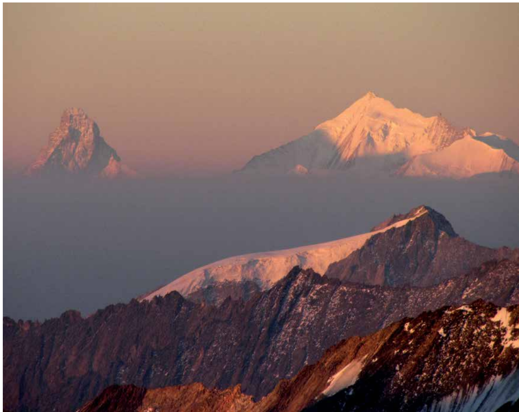
Matterhorn, Weiss- und Bishorn vom Lauteraarhorn aus