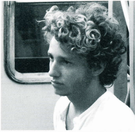
SIEBEN FRAGEN [16]